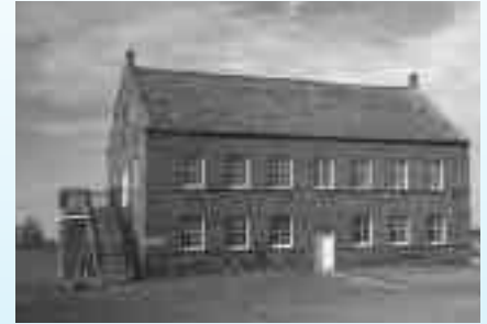
Édifice de la Banque des fermiers de Rustico, à l'Île-du-Prince-Édouard, qui a été transformé en musée afin de commémorer l'œuvre de son fondateur.

Un autre palier déterminant de l'expression de l'identité francophone et acadienne peut émerger des phénomènes de la ruralité et de l'urbanité. L'homogénéité des milieux ruraux ou la mosaïque culturelle des métropoles ont des effets bien sentis sur la façon que les francophones se perçoivent sur les plans individuel et collectif. Par exemple, nous avons constaté que les francophones qui vivent à Toronto ou à Vancouver ont une vision davantage pluraliste de leur identité. De leur côté, les Acadiens qui vivent à Caraquet ont un attachement beaucoup plus marqué à leur langue et à leur patrimoine culturel. Il nous est apparu que le milieu ambiant dans lequel vivent les francophones peut exercer une influence considérable dans la fabrication identitaire.