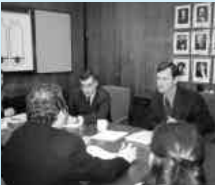
Rencontre avec deux ministres du gouvernement de l'Ontario : John Baird, ministre des Services sociaux et communautaires, et délégué aux Affaires francophones ainsi que Tony Clement, ministre des Affaires municipales et du Logement. Cette rencontre a eu lieu à Toronto, le 12 avril 2000.

Dans une majorité de provinces et territoires, nous avons pu constater l'existence d'une instance désignée, généralement au sein du ministère qui s'occupe des relations intergouvernementales, qui a pour mandat de promouvoir l'offre de services en français, de servir de liens entre la communauté francophone et les différents ministères et d'offrir des services de traduction. Ces initiatives gouvernementales méritent d'être reconnues. C'est le cas en Ontario, en Saskatchewan, au Manitoba, en Alberta, au Yukon, en Nouvelle-Écosse, à Terre-Neuve et au Labrador, à l'Île-du-Prince-Édouard ainsi qu'en Colombie-Britannique où la mise sur pied d'un