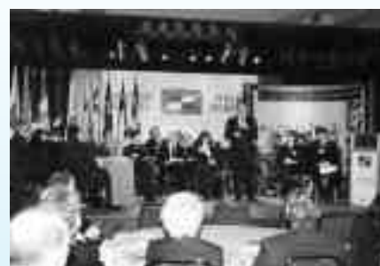
Forum de discussion Dialogue qui se tenait le 17 mars 2000, à Québec, dans le cadre du Forum des partenaires de la francophonie organisé par le Secrétariat aux affaires intergouvernementales canadiennes (SAIC) du gouvernement du Québec.

Après la disparition avouée du Canada français en tant que symbole national, on a pu observer une certaine forme de morcellement de l'identité francophone au Canada. La manifestation de luttes régionales a aussi contribué à ce nouveau