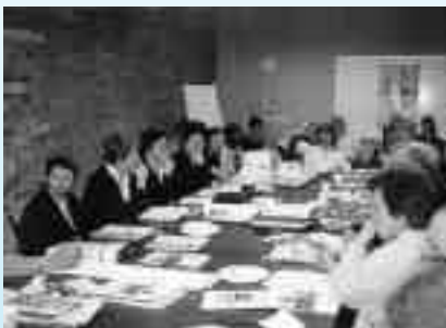
Forum de discussion avec la communauté francophone de Victoria, en Colombie-Britannique, le 11 mai 2000.

« Avant, avec l'appellation Canadien français, on faisait surtout référence au Québec et au Nouveau-Brunswick. Aujourd'hui, le fait d'avoir des noms comme Fransaskois, Franco-Albertain, Franco-Ontarien, nous permet de prendre conscience et d'accepter qu'il y a d'autres réalités francophones. »