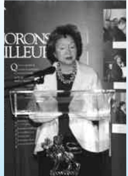
La Gouverneure générale, Son Excellence la très honorable Adrienne Clarkson, lors de son discours prononcé à l'occasion de la réception donnée à Rideau Hall pour le lancement officiel de Dialogue , le 11 février 2000.

« Que nous ayons réussi à faire face à toutes ces formes de diversité simultanément tout en arrivant à vivre ensemble dans une atmosphère de paix et de civilité est, selon tous critères objectifs, un accomplissement remarquable. Nous accommodons un niveau d'immigration qui dans la plupart des pays provoquerait un nationalisme xénophobe;