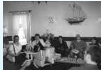
Groupe de jeunes rencontré à Caraquet, Nouveau-Brunswick, le 5 juin 2000.

Si les communautés francophones et acadiennes veulent participer pleinement à un espace francophone international, elles doivent s'assurer de favoriser l'émergence d'une communauté nationale francophone renouvelée. Les intérêts communs des communautés francophones et acadiennes et ceux des francophones du Québec