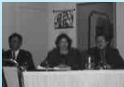
La première ministre du Yukon, l'honorable Pat Duncan, conférencière lors du forum de discussion qui se tenait à Whitehorse, le 16 mai 2000.

La réflexion que nous proposons aux communautés francophones et acadiennes sur la question de l'immigration touche plusieurs volets. Le premier volet relève de la conscientisation. Avant d'entamer toute démarche, il faut que la francophonie canadienne comprenne pleinement les enjeux reliés à l'immigration francophone au Canada. Si les communautés ne s'approprient pas la responsabilité d'agir dans ce dossier, personne ne le fera à leur place.