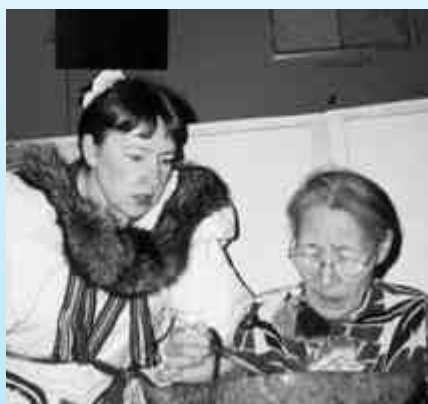
Cérémonie inuit à Iqaluit, Nunavut, le 4 mars 2000.

de ces trois grands groupes une diversité dont il faut tenir compte. La concentration de leurs populations a un effet direct dans le développement des liens. Par exemple, les Inuits sont principalement concentrés dans le Nord du Québec et dans le nouveau territoire du Nunavut, tandis que les Métis sont dispersés dans l'Ouest canadien. Les communautés autochtones doivent aussi la plupart du temps composer avec l'isolement géographique, ce qui a un effet non-négligeable dans la création et le maintien des relations entre les autochtones et les non-autochtones. Il ne faut pas non plus oublier la spécificité des autochtones habitant dans les trois territoires du Nord canadien.