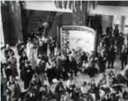
Célébration de la journée de la francophonie terre-neuvienne et labradorienne à l'Assemblée législative, à St. John's, Terre-Neuve et Labrador, le 30 mai 2000.

S'il est vrai que le Canada est un pays fondé sur la diversité, il n'en reste pas moins que des défis importants se posent sur le plan des relations entre les divers groupes qui le composent.