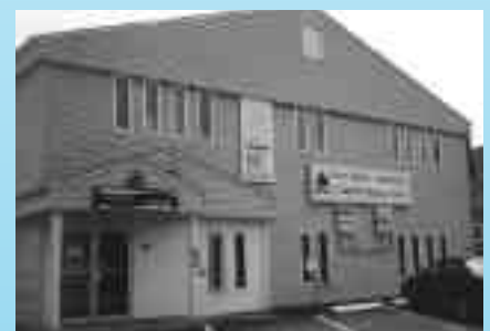
Édifice abritant le Centre de formation Wellington du Collège de l'Acadie et le Centre d'affaires communautaire, à Wellington, Île-du-Prince-Édouard.

Que ce soit la Banque des fermiers, le Collège de l'Acadie ou le Centre d'affaires communautaire, ces institutions du passé et de présent sont des maillons importants du réseau institutionnel développé par la communauté acadienne de l'Île-du-Prince-Édouard et des autres provinces de l'Atlantique.