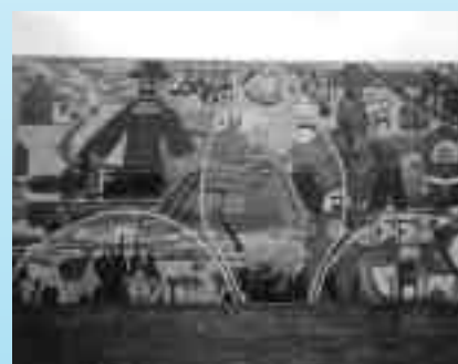
Murale de la francophonie qui orne l'un des murs de l'École Monseigneur de Laval, à Regina, Saskatchewan.

Depuis les États généraux du Canada français de 1967 jusqu'à aujourd'hui, la francophonie canadienne a connu de nombreux changements, notamment en ce qui concerne les droits linguistiques, l'éducation et le développement communautaire.