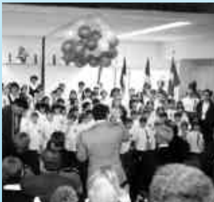
Inauguration de l'École Allain St-Cyr, à Yellowknife, Territoires du Nord-Ouest, le 27 février 2000.

Avec ce rapport, le groupe de travail veut mettre en valeur des éléments susceptibles d'améliorer le cadre des relations entre les différentes composantes de la société canadienne. Il veut aussi apporter quelques éléments de réflexion sur certains secteurs d'activités qui sont cruciaux au développement de la francophonie canadienne.